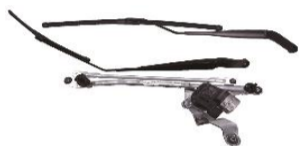
フロントワイパーシステム