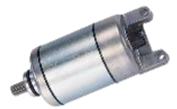
スターターモーター