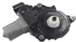
パワーウインドウモーター